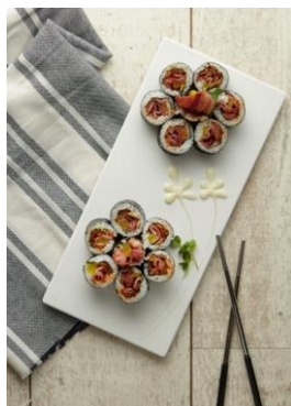
Oppa 煙肉卷 $68

泡菜和煙肉是韓食人氣組合，School Food 將煎香的煙肉配上自家醃漬的醬蘿蔔 Jjang a Chi，及炸得金黃香脆的薄蒜片製成酥脆可口的餡料，再以加入蛋黃醬的米飯和烤紫菜捲起，惹味十足。